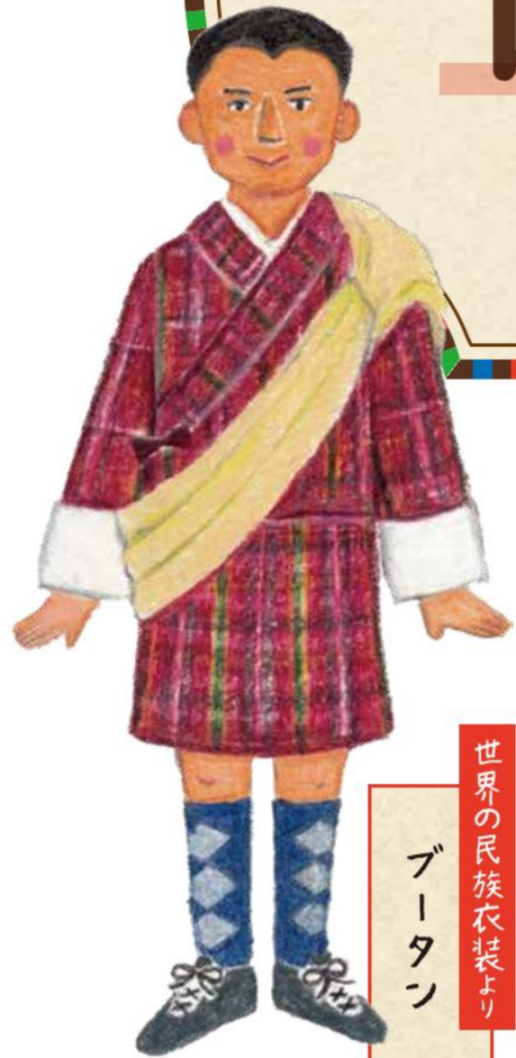
世界の民族衣装より ブータン

世界の民族衣装や日本各地の祭りの衣装を中心に、 子どもから大人まで楽しめる、愛らしいイラスト作品をご紹介します!