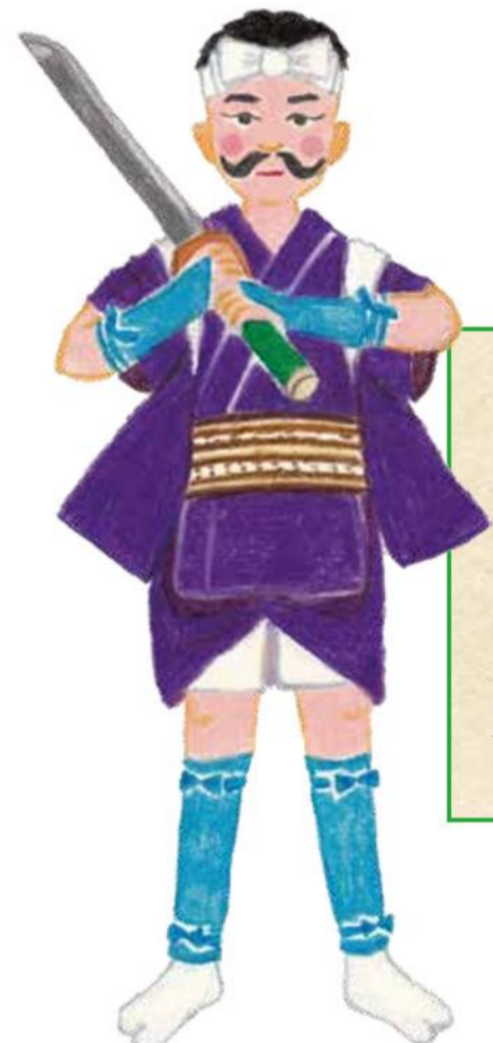
日本の祭りの衣装より 岡山県(牛窓) 太刀踊り