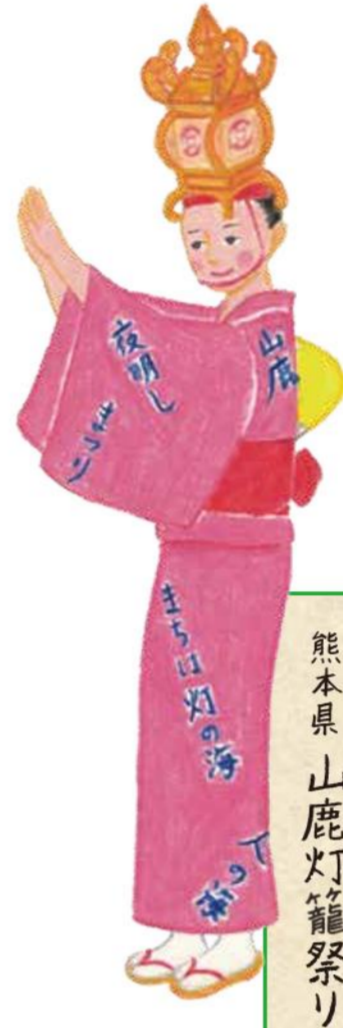
日本の祭りの衣装より 熊本県 山鹿灯籠祭り