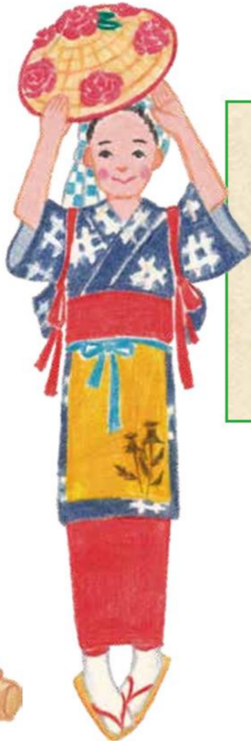
日本の祭りの衣装より 山形県 山形花笠祭り