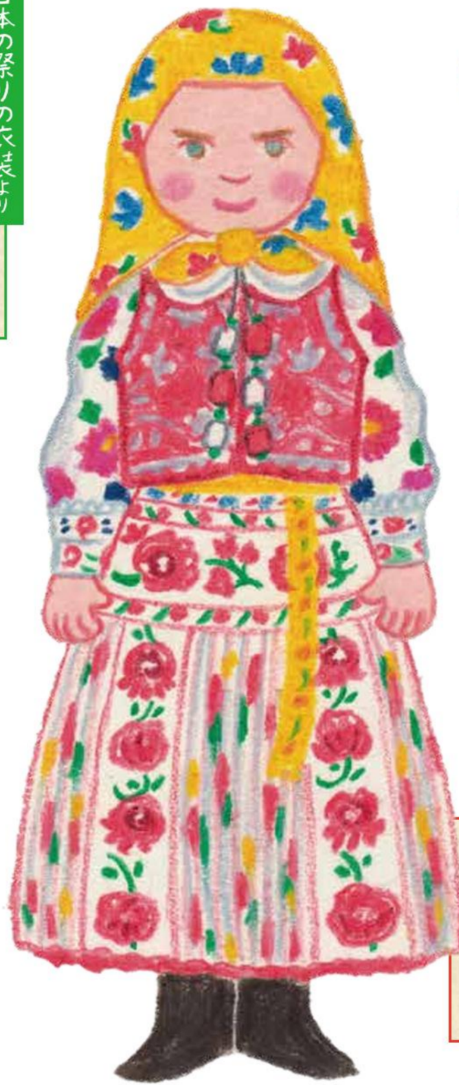
世界の民族衣装より ルーマニア