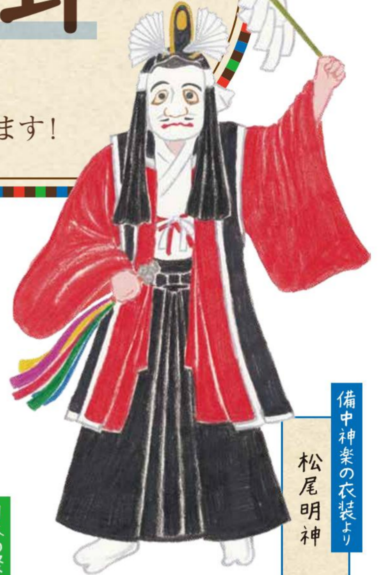
備中神楽の衣装より 松尾明神