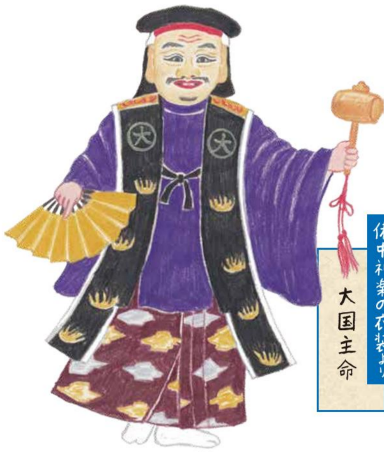
備中神楽の衣装より 大國主命