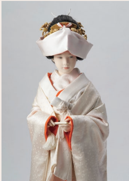
秋刀魚の味 - 嫁ぐ日 (2005)